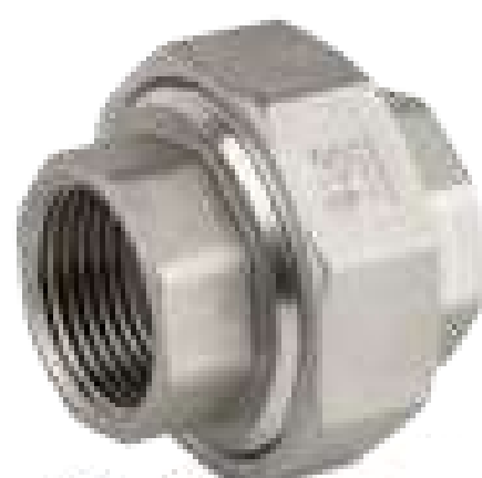
UNIÃO INOX 150 ROSCA