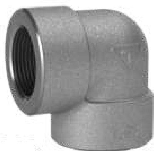
COTOVELO 90 ROSCA