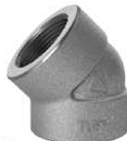
COTOVELO 45 ROSCA