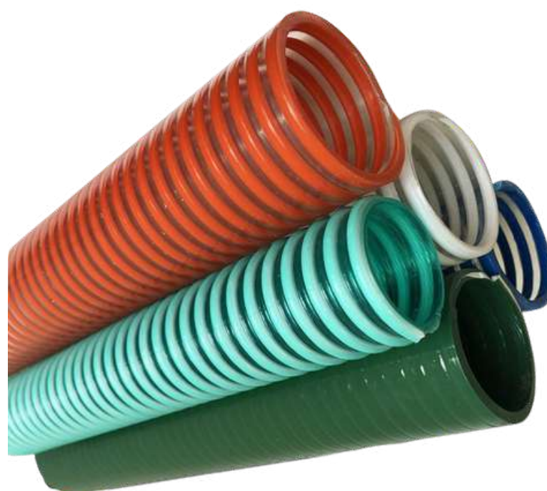
MANGOTE DE SUCÇÃO