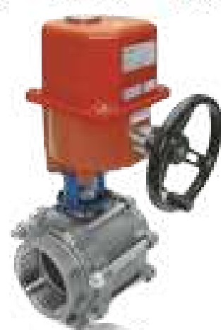
VAL ESF TRI-PARTIDA C. ATUADOR