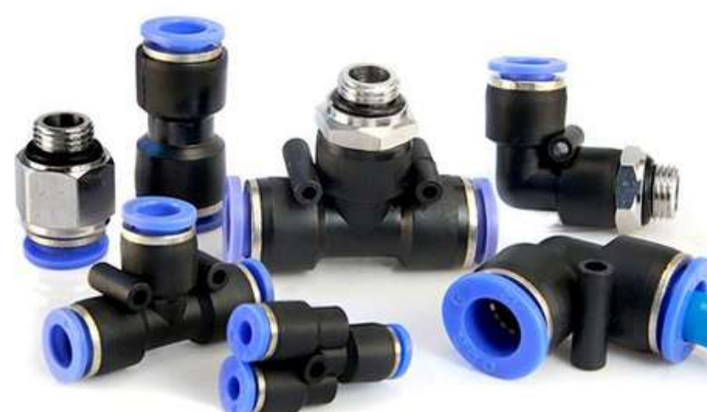
PUSH-IN PU INSTANTÂNEO