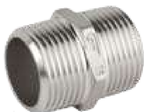
NIPLE SEXTAVADO INOX 150 ROSCA