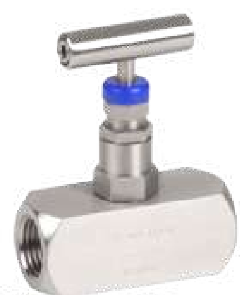
VAL AGULHA TOTAL INOX ROSCA F X F