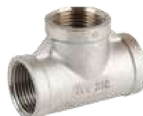
TE INOX 150 ROSCA