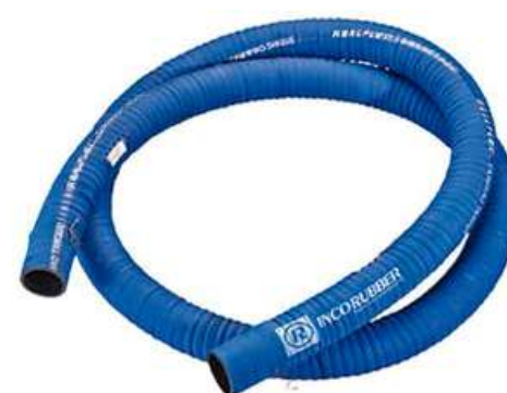
MANGOTE CAMINHÃO TANQUE