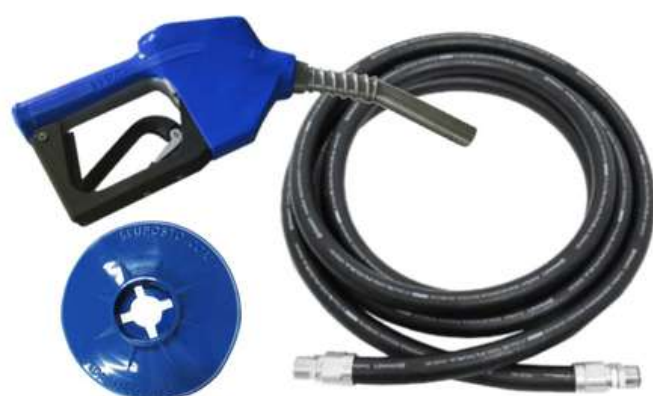
MANGUEIRAS DE ABASTECIMENTO