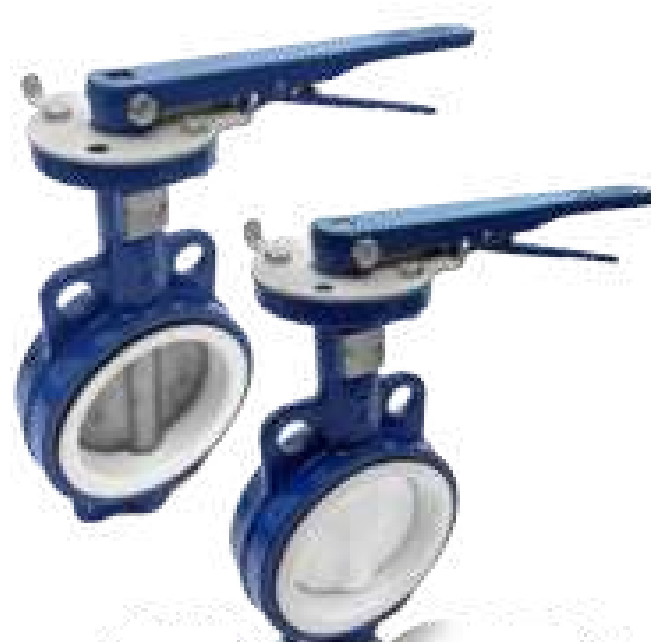
VAL BORB WAFER COM ALAVANCA