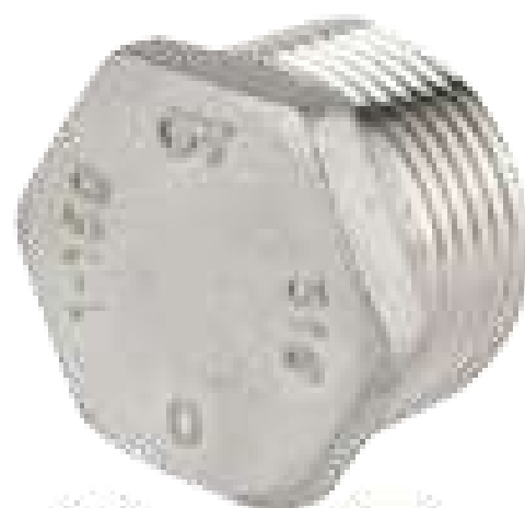
BUJÃO INOX 150 ROSCA