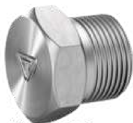
BUJÃO CAB. SEXT. ROSCA