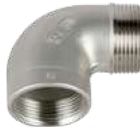
COTOVELO INOX 90GR MF 150 ROSCA