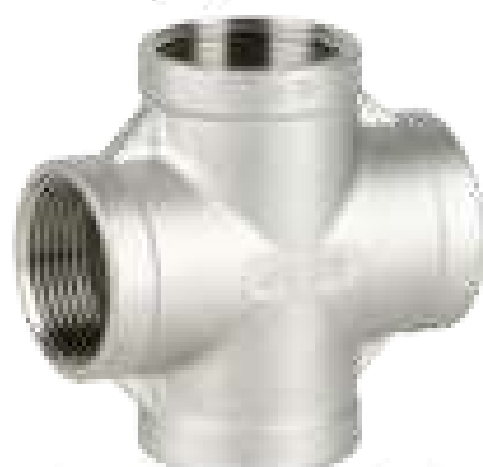
CRUZETA INOX 150 ROSCA