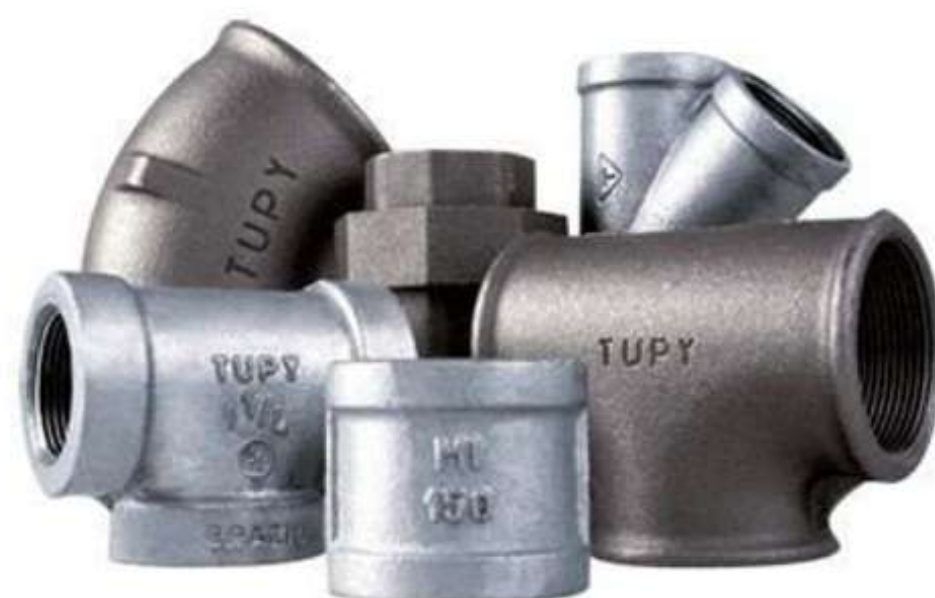
CONEXÕES EM GERAL