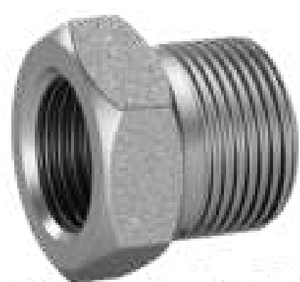
BUCHA RED ROSCA