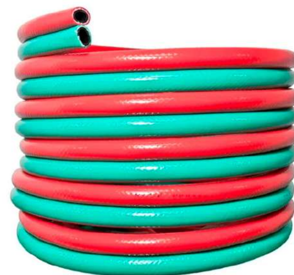
ACETILENO E OXIGÊNIO