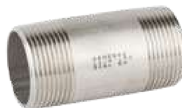
NIPLE INOX TUBULAR SCH ROSCA