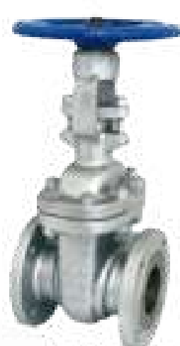
VAL GAVETA FL WCB COM VOLANTE