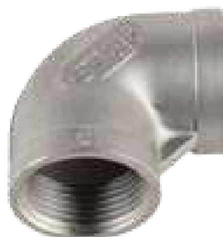
COTOVELO INOX 90GR 150 ROSCA