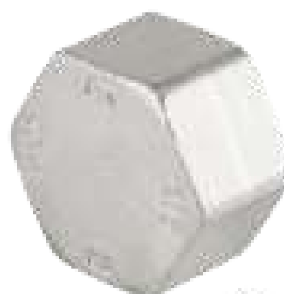
TAMPÃO (CAP) INOX 150 ROSCA