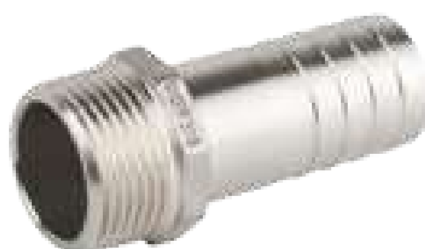
ESPIGÃO INOX ROSCA X ESCAMA