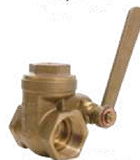
VAL GAVETA FEC RÁPIDO