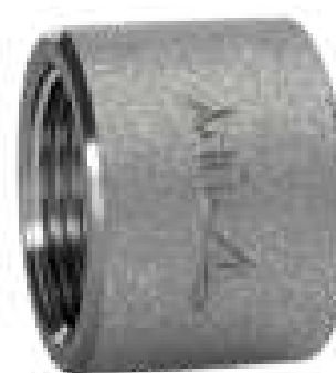
MEIA LUVA ROSCA