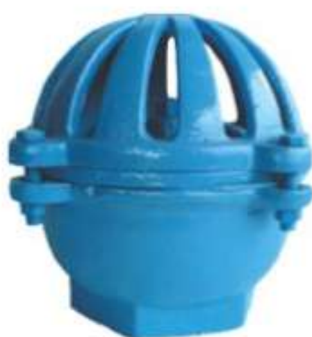
VAL FUNDO POÇO