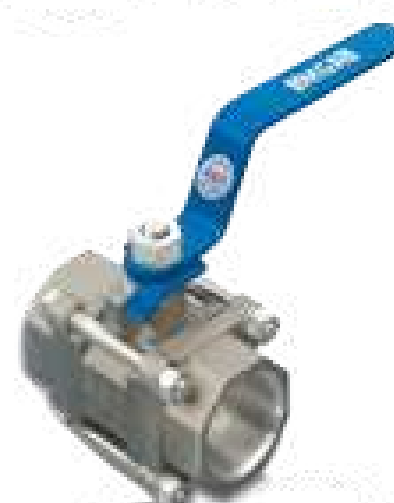
VAL ESF TRI-PARTIDA