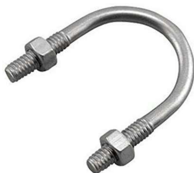
GRAMPO TIPO U