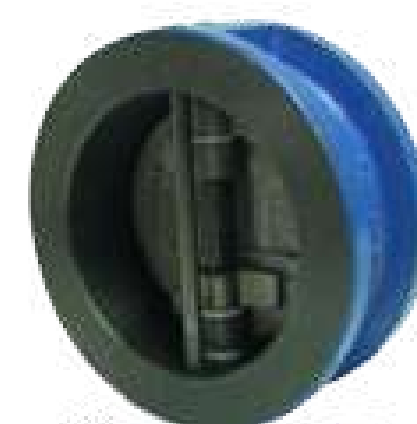
VAL RET DUP PORTINHOLA