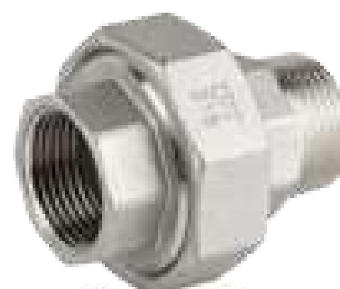
UNIÃO INOX MF 150 ROSCA