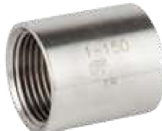
LUA INOX 150 ROSCA