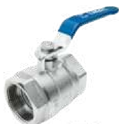
VAL ESF MONOBLOCO