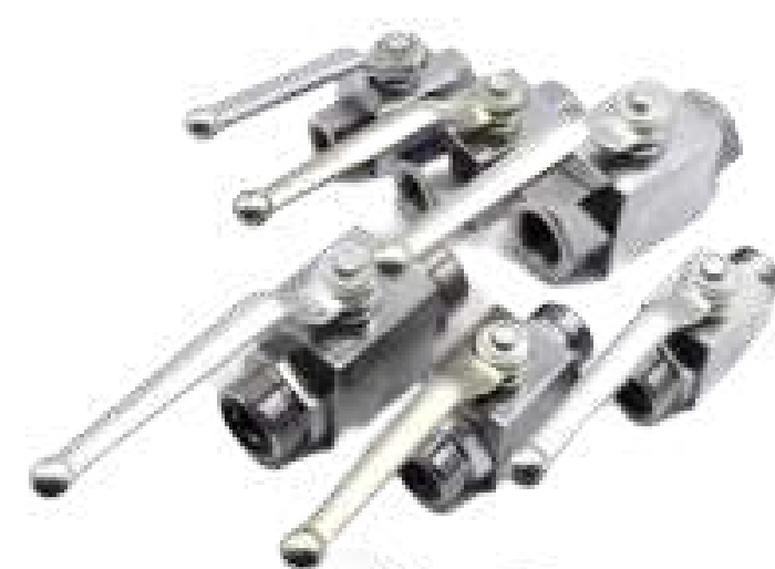
VAL ESF AÇO