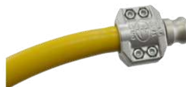
ARF-SAFETY CLAMP MONTADA