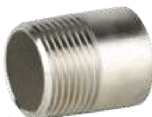
PONTA INOX ROSCA