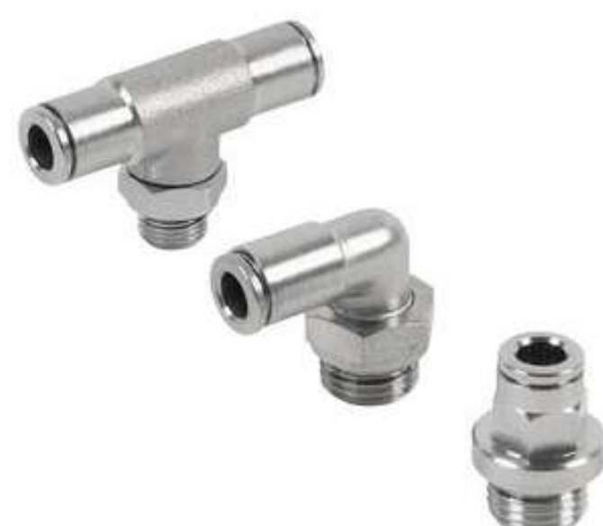
PUSH-IN LATÃO NIQUELADO