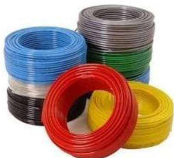
TUBO LISO PU