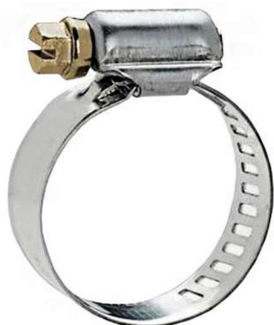
ROSCA SEM FIM