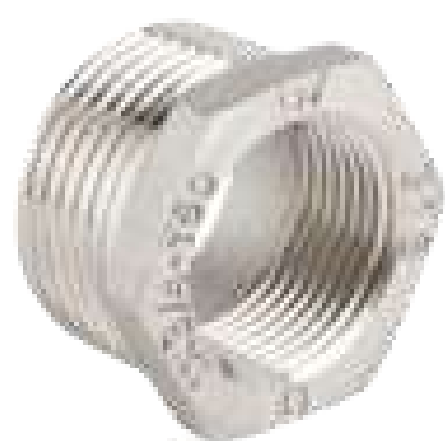
BUCHA RED INOX 150 ROSCA