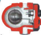
Purgador de Bóia