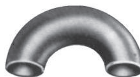
Curva 180° RL