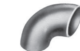
Curva 90° RL