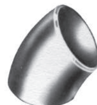
Curva 45° RL