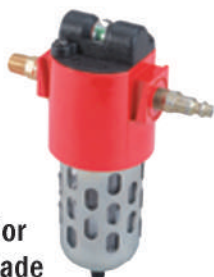
Separador de Umidade