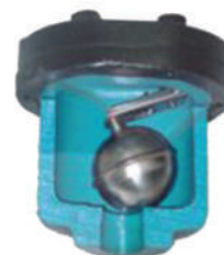
Separador de Ar