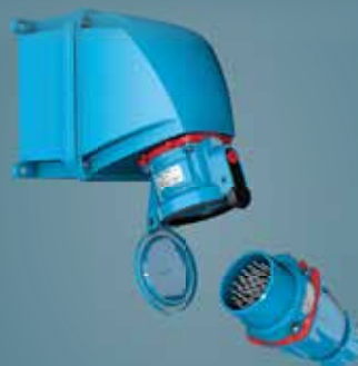
TOMADAS E CONECTORES PARA AMBIENTES SEVEROS