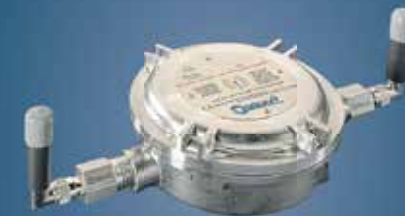
COMUNICAÇÃO E MONITORAMENTO WI-FI E ETHERNET Ex