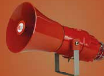
SINALIZAÇÃO AUDIOVISUAL INDUSTRIAL