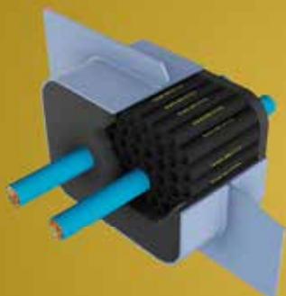
SISTEMAS PARA SELAGEM DE PASSAGEM DE CABOS E TUBOS