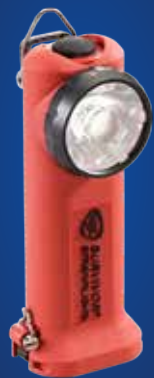
LANTERNAS LED PROFISSIONAIS