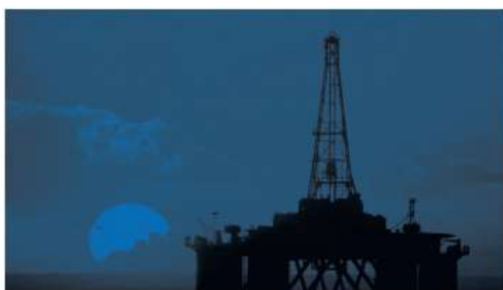
Petróleo e Gás