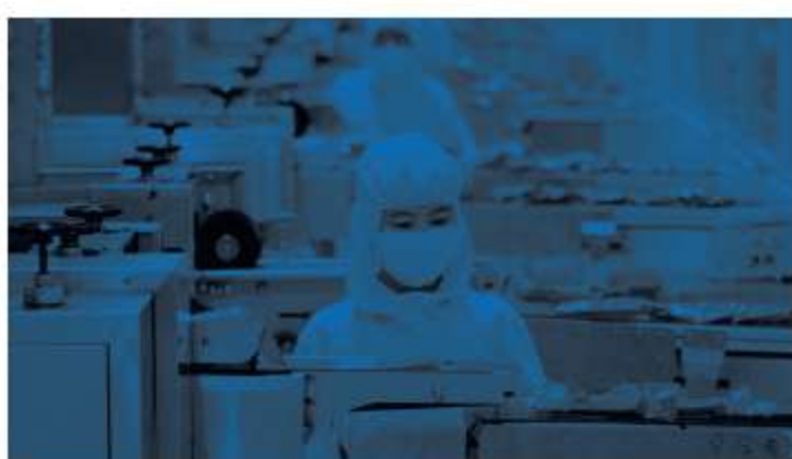
Indústria Alimentícia e Farmacêutica