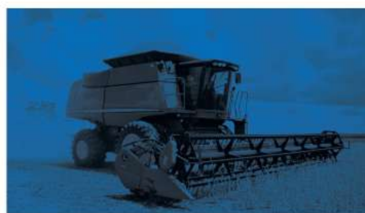
Máquinas Agrícolas e de Construção