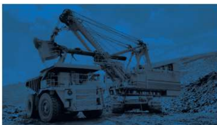
Mineração e Siderurgia