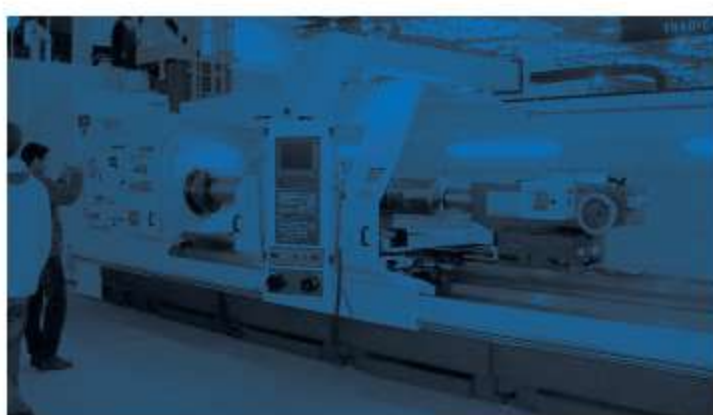
Máquinas e Ferramentas